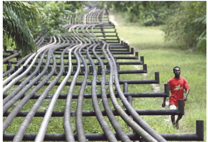
Pipeline au Nigeria

À titre d'exemple, la 9 e session de la Commission mixte de coopération bilatérale entre l'Algérie et le Niger, tenue en avril 2008, a été l'occasion de la signature de différents accords portant, entre autres, sur la formation et